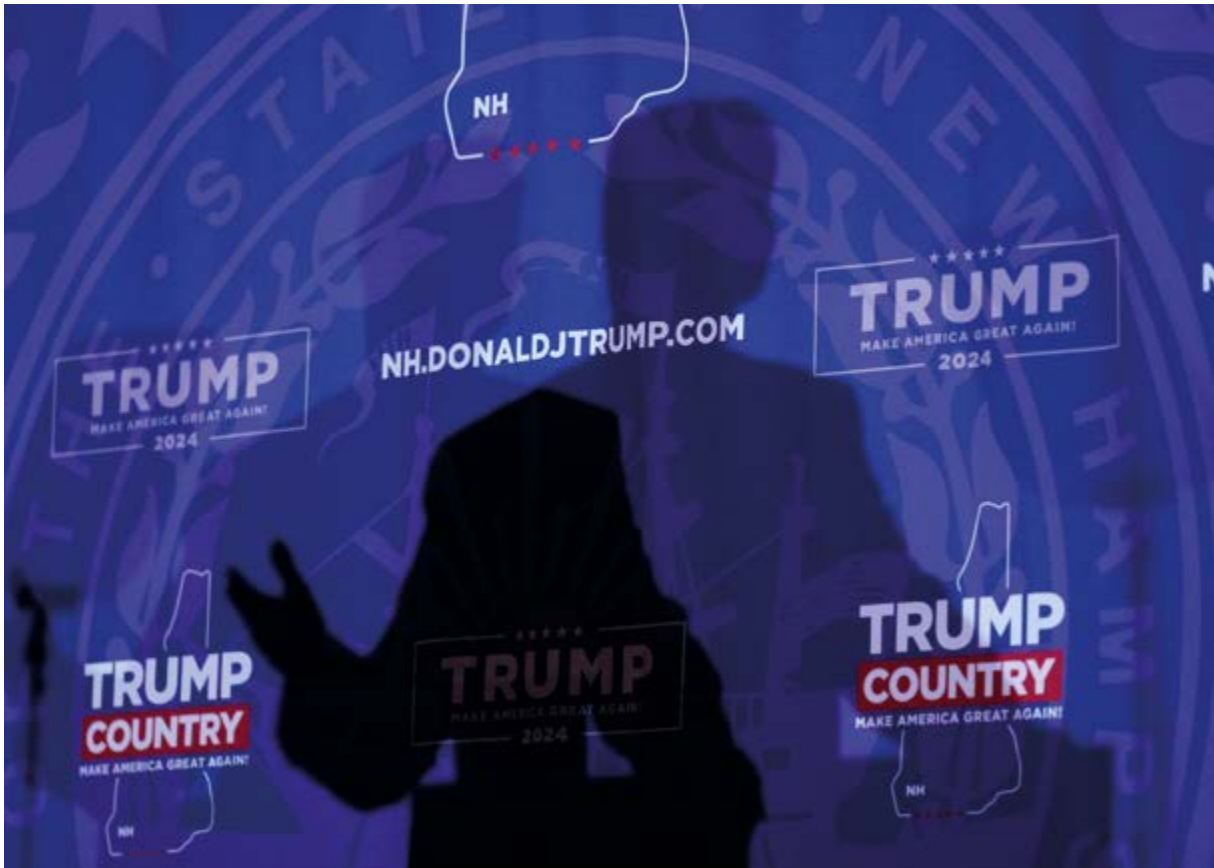
Unklares Bild: Ob Donald Trump im November erneut zum US-Präsidenten gewählt wird, ist genauso offen wie die Frage nach seiner konkreten Politik gegenüber der NATO. Klar ist dagegen, was Deutschland und Europa tun können: mehr in ihre eigene Verteidigung investieren.

es die US-Kräfte entsprechend einzuteilen gelte und die Europäer endlich für ihre eigene Sicherheit zu sorgen hätten.