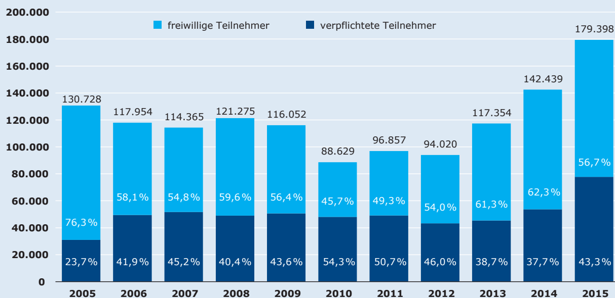
Teilnehmerzahlen Integrationskurse 2005 - 2015

Quelle: Bundesamt für Migration und Flüchtlinge: Neue Kursteilnehmer in den Jahren von 2005 bis 2015 nach freiwilligen und verpflichteten Teilnehmern. Flyer Schlüsselzahlen „Integrationskurse“ , in: https://www.bamf.de/SharedDocs/Anlagen/DE/Publikationen/Flyer/flyer-schluesselfzahlen-integrationskurse.pdf?__blob=publicationFile .