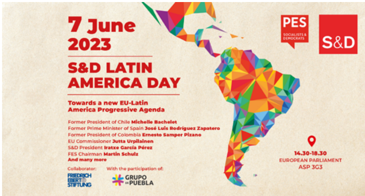
6. s&D Latin America Day, evento de la bancada socialista en el Parlamento Europeo con el Grupo de Puebla, 2023.