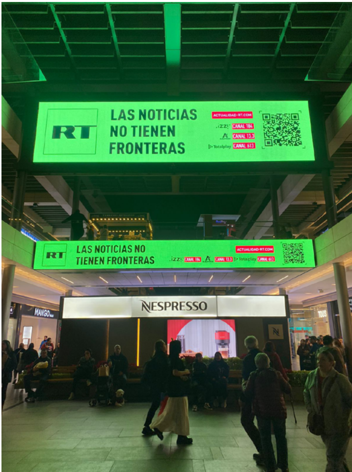
18. Campaña publicitaria de RT en centro comercial Oasis Coyoacán, Ciudad de México (2023).