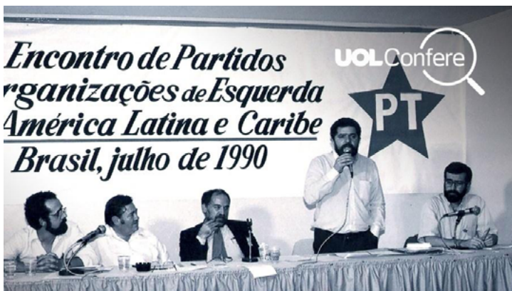
1. Lula da Silva en reunión Foro de São Paulo de 1990. São Paulo, Brasil.