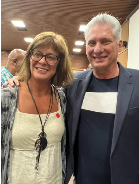
11. La directora de CLACSO, Karina Batthyány junto al presidente de Cuba, Miguel Díaz-Canel en 2023. La Habana, Cuba.