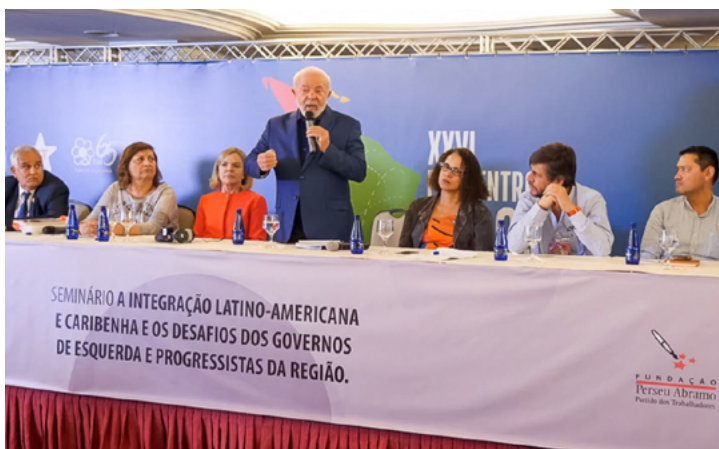
2. Lula en discurso de apertura del 26 Foro de São Paulo de 2023. Brasília.